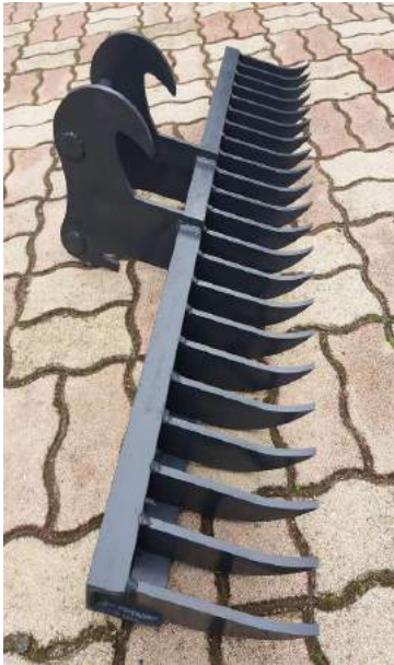
Roderechen für Minibagger TB125 - angefertigt auf Kundenwunsch.

Mobiles Schweißbohrwerk , mit dem direkt vor Ort durch automatisch mechanisiertes Auftragsschweißen und anschließender Bearbeitung mit ein und derselben Maschine durch einfachen Tausch der Werkzeuge Bohrungen oder Wellen ( \varnothing 32 - 250 mm) der defekten Maschinen instandgesetzt werden können. Dabei wird das mobile Schweißbohrwerk an das defekte Gerät (Bagger, Kran, Radlader, Raupe, Brecher etc.) direkt vor Ort angeschlagen - meist ohne große Demontage der defekten Teile und ohne spezielle Kenntnisse des Anwenders - und danach wird die defekte Maschine durch eine oder mehrere Auftragsschweißungen und anschließender spanabhebender Bearbeitung repariert. Das wirkt sich auch auf eine weit höhere Lebensdauer (1/3) der doch sehr kostenintensiven Bolzen und Büchsen aus.